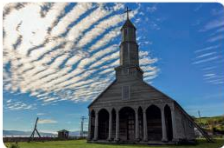
» Iglesia de Chiloé, Zona Sur.

3 ¿Qué otras religiones son parte de nuestra sociedad actualmente?