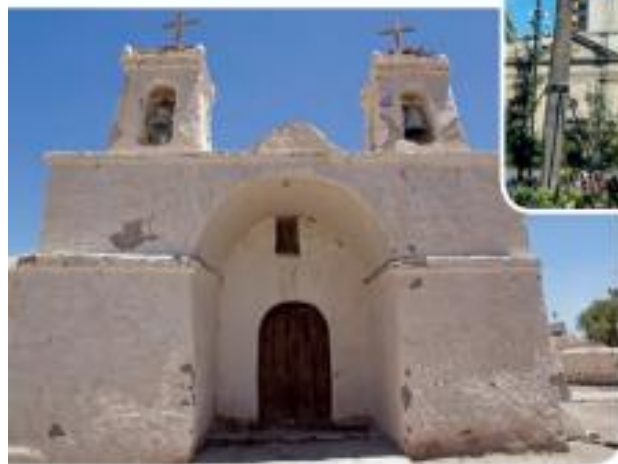
» Iglesia de Chiu Chiu, Zona Norte.