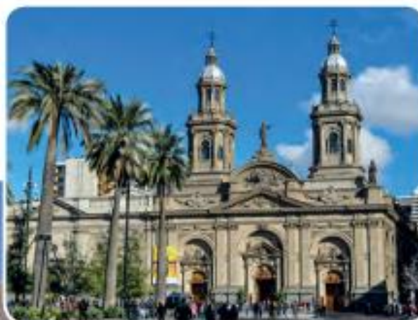
« Catedral de Santiago, Zona Central.

Fuente: Memoria Chilena. Misioneros y mapuches. (Fragmento adaptado).